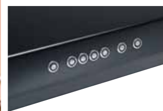
Commande électronique Modèle C370