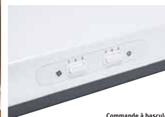
Commande à bascule Modèle C180