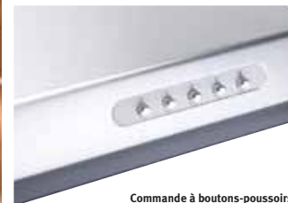
Commande à boutons-poussoirs Modèles C600M et C270