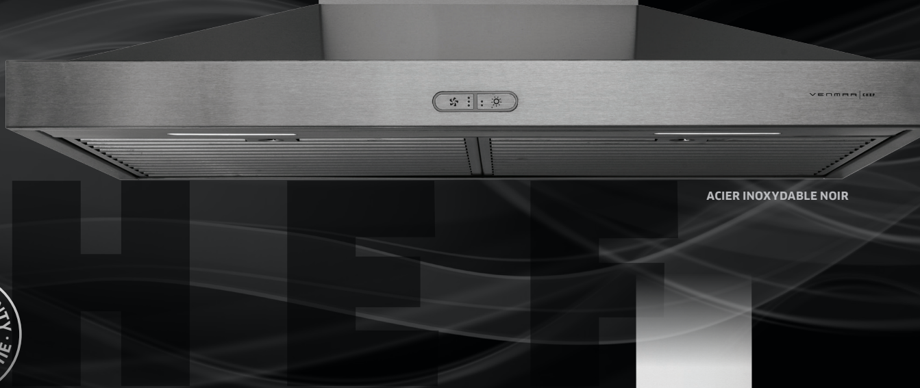
ACIER INOXYDABLE NOIR